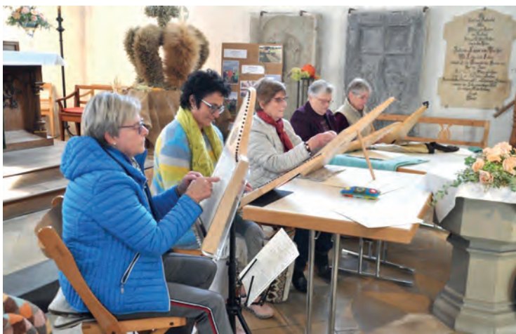
Den Festnachmittag umrahmte die Veeh Harfengruppe aus Memmingen musikalisch.