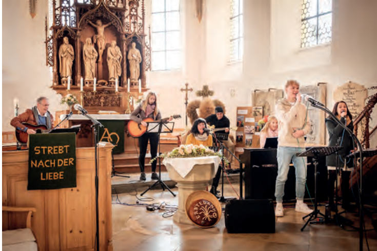
Den Festgottesdienst bereicherte die Nimm 3 Band des CVJM.

Unter dem Motto, "Soli Deo Gloria", Allein Gott die Ehre, feierte die Landeskirchliche Gemeinschaft Woringen ihr 150 jähriges Bestehen.