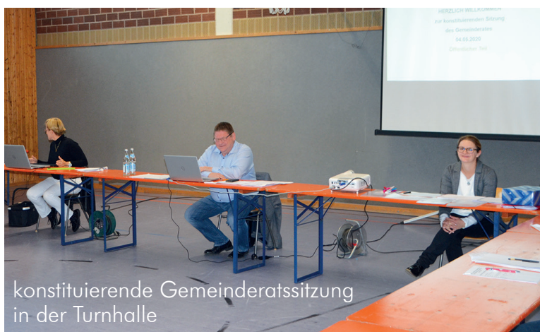
konstituierende Gemeinderatssitzung in der Turnhalle