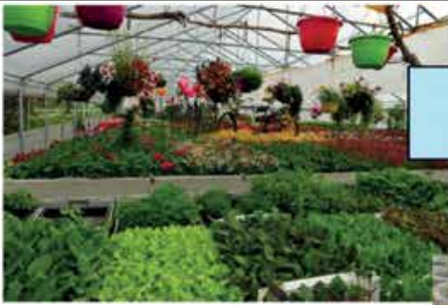
Die Gärtnerei mit Blumen- und Pflanzenverkauf.