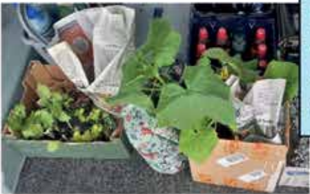
Nach Kaffee und leckeren Kuchen ging's dann mit einem, wegen der tollen Bergsicht, kleinen Umweg zurück nach Worringen. Ein paar Pflanzen wurden von manchem natürlich auch noch mitgenommen.