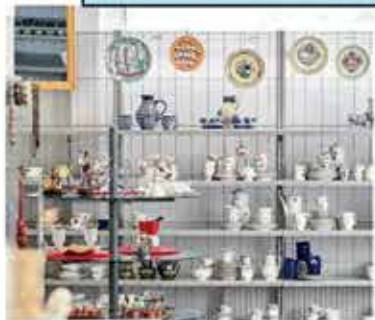
Unsere Betriebe: Winkiste