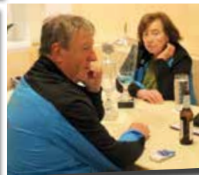
„Schade, nicht König geworden“

Der Schützenverein lädt ganz herzlich zum Gauschießen in Erkheim ein. Geschossen wird noch täglich bis zum 05.06, jeweils von 17 30 - 22 00 Uhr in der Festhalle Erkheim. Preisverteilung ist am Sonntag, dem 14.06 ab 11 00 Uhr mit Fahne und Königen. Nähere Infos unter "sv-erkheim.de" im Internet oder beim Schützenmeister direkt. Die Vorstandschaft bittet um vollständige Teilnahme der Mitglieder.