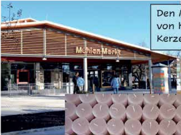
Den MühlenMarkt mit Verkauf von handgefertigten Waren, Kerzen und Lebensmitteln.