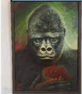
Eine Ausstellung mit Werken von Bewohnern wurde auch gerade eröffnet.