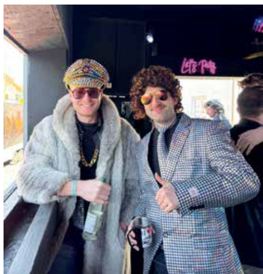
Euer Faschingsverein Worringen

Mit großer Vorfreude blicken wir bereits auf die nächste Faschingsaison und unser Motto „Disco Fever“ für die Jahre 2025 und 2026. Gemeinsam wollen wir den Fasching in Worringen lebendig halten, feiern, tanzen und unsere Straßen erneut zum Strahlen bringen!