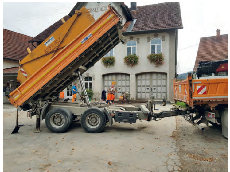
Das Rathaus und die Schule wurden mit Glasfaser angeschlossen.

Der öffentliche Teil der Sitzung wird um 21:10 Uhr geschlossen und sodann mit dem nichtöffentlichen Teil fortgefahren.