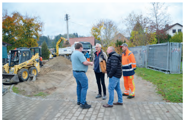
Der Neubau an der Schule für die OGTS wurde begonnen.