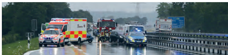
New Facts Pöppel

Einsatz: Am Donnerstagnachmittag, 29.04.2021 gegen 15:15 Uhr, befuhr ein 20-Jähriger mit einem Kleintransporter die BAB A7 in nördliche Fahrtrichtung (Ulm/Würzburg). Der Mann aus dem Raum Weingarten war in Begleitung von seinem 20-jährigen Arbeitskollegen, welcher sich auf dem Beifahrersitz befand. Zwischen der Anschlussstelle Woringen und der Anschlussstelle Memmingen-Süd kam der Fahrzeugführer aus bislang ungeklärter Ursache nach links von der Fahrbahn ab. Dabei prallte dieser zweimal gegen die dortige Mittelleitplanke. Anschließend geriet der Kleintransporter ins Schleudern und kippte auf die rechte Fahrzeugseite. Im weiteren Verlauf schlitterte dieser noch ca. 70 Meter über die Fahrbahn, bis er zwischen dem Pannestreifen und dem rechten Fahrstreifen zum Stillstand kam.