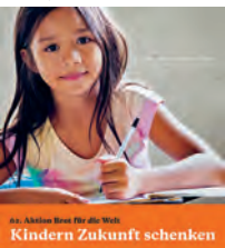
„Brot für die Welt“ Kindern Zukunft schenken

Näheres finden Sie auch im nächsten Gemeindebrief. Herzliche Einladung!