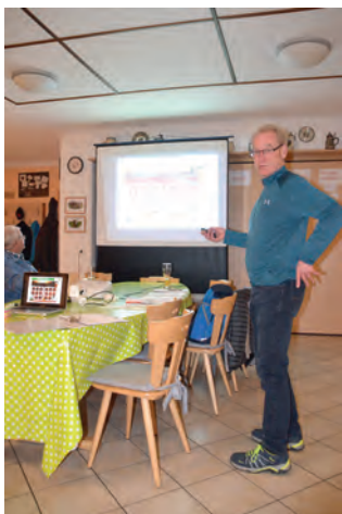
Das Adventsfenster 2021 findet wie 2020 wieder als „stilles“ Adventsfenster statt.

kurzen Ausblick auf die Vorhaben im Jahr 2022. So sind ein Vortrag über ein aktuelles Thema, eine Betriebsführung, Infoveranstaltungen, das Adventsfenster und eine Exkursion vorgesehen.