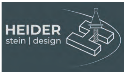
Heider Stein Design GbR