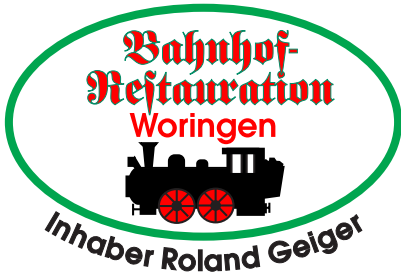
Bahnhof-Restaurations Roland Geiger