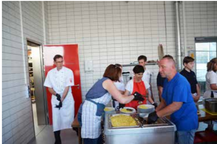
die fleißigen Küchenhelfer/innen mit Koch (links)