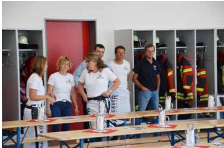
das Bedienungspersonal – noch ganz ruhig