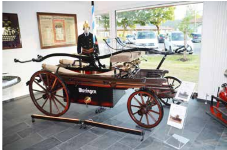
die restaurierte Spritze