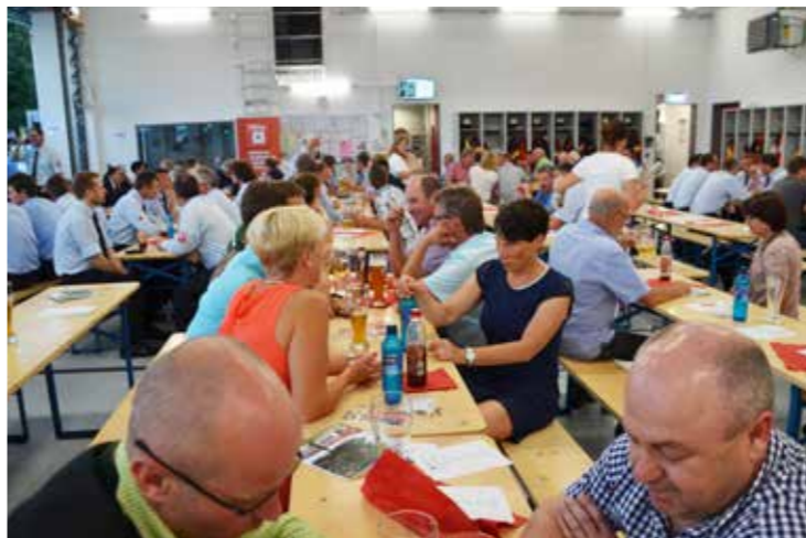
ganz wichtige Menschen