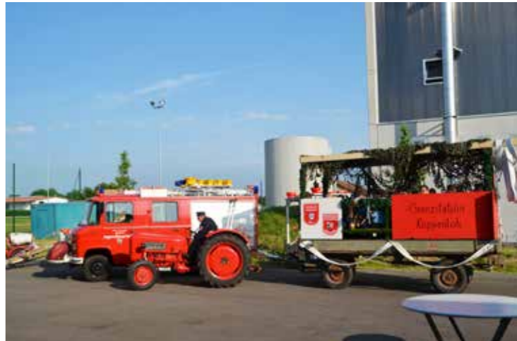
der Patenverein aus Zell