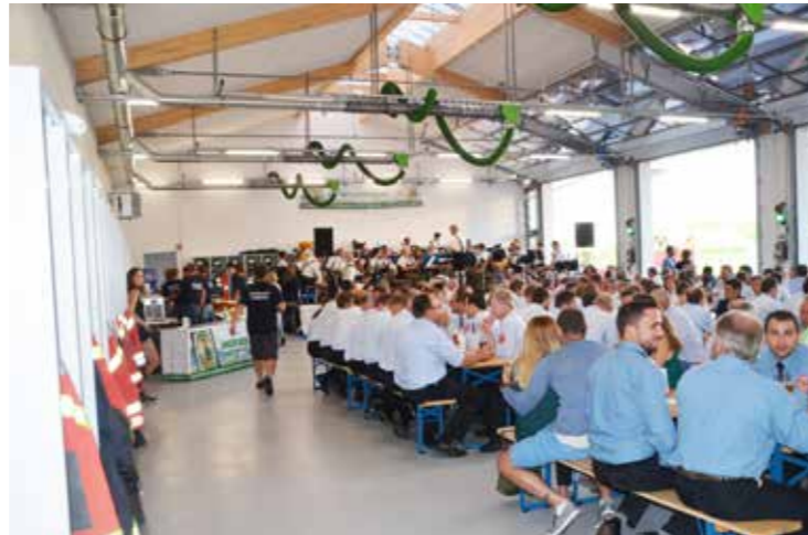
die gut besetzte „Festhalle“