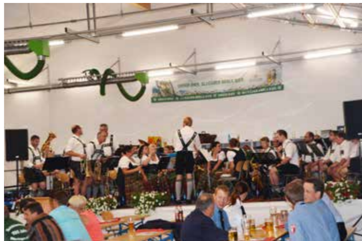
die Allgäuer Dorfmusikanten aus Böhmen