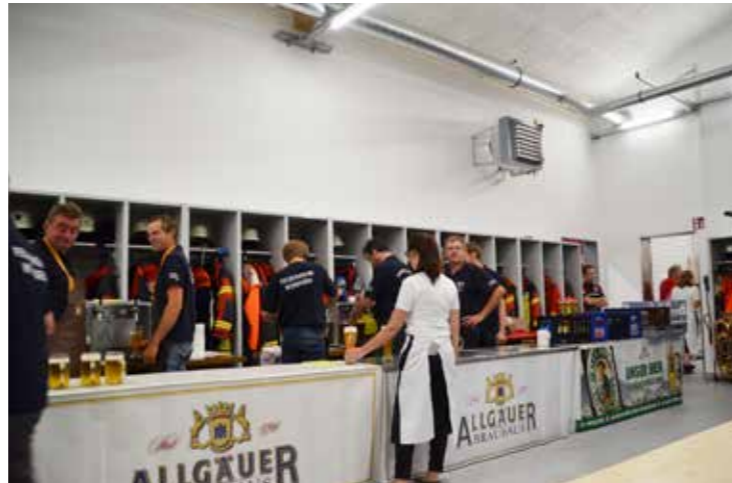
ein Teil der fleißigen Mannschaft