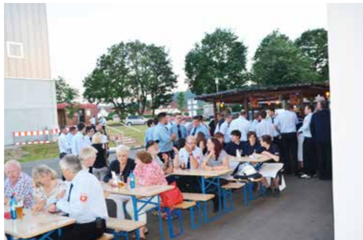
auch draußen war's sehr angenehm