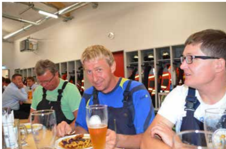
ein Teil der Öl-Einsatzmannschaft