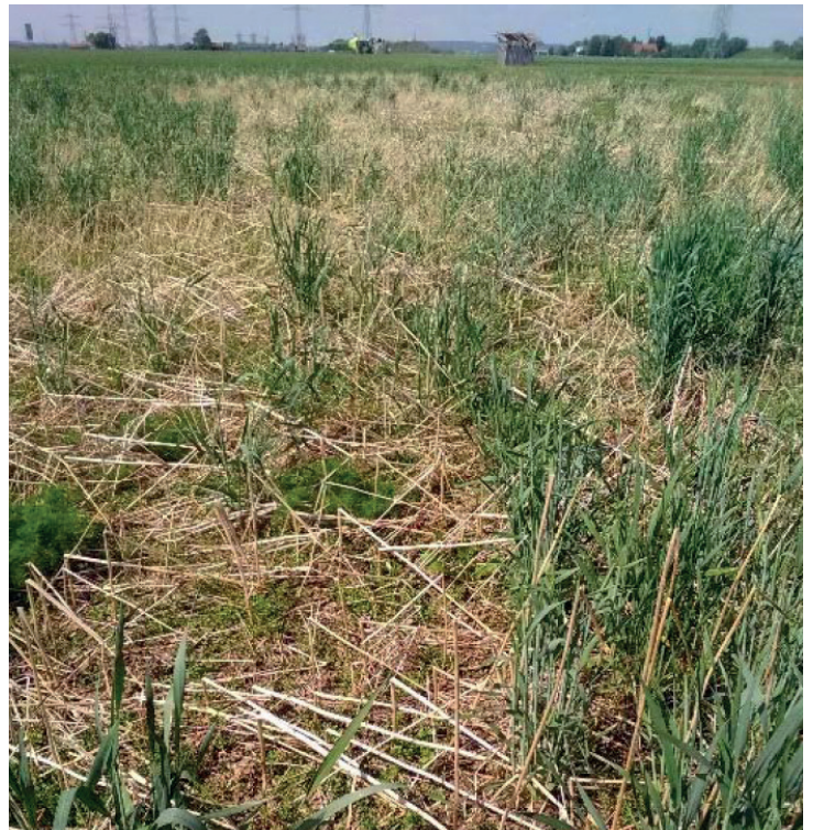
Senf, Kresse, Ramtilkraut, Phacelia, Roggen vom Vorjahr