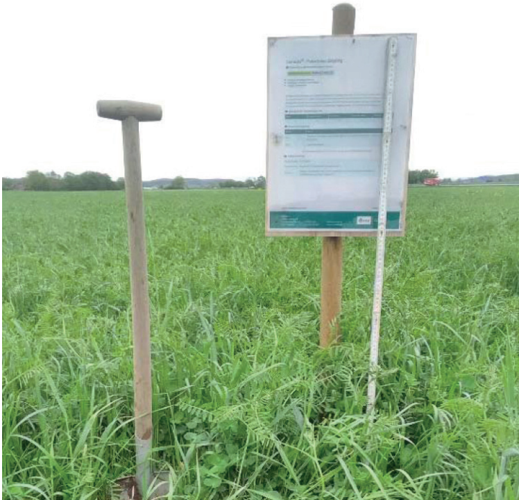
Deutsches Weidelgras Winterwicke, verschiedene Kleearten,

Dieses mal geht es mit dem Zwischenfruchtversuch weiter. Die verschiedenen Zwischenfruchtmischungen sind zum Teil abgefroren, die winterharten Pflanzen sind grün geblieben.