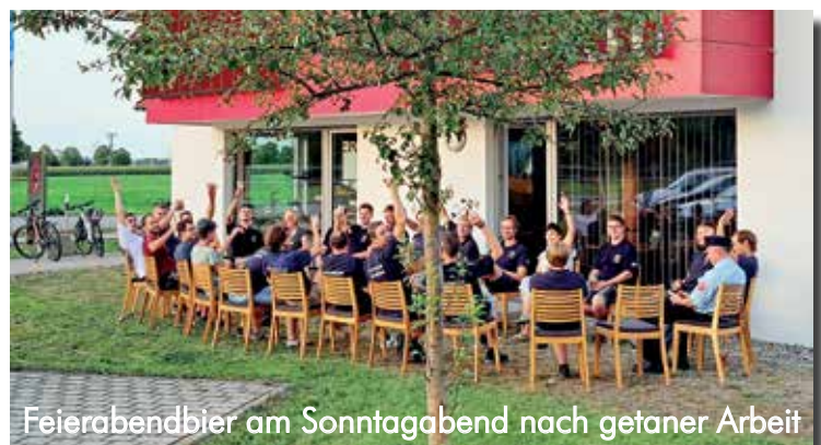
Feierabendbier am Sonntagabend nach getaner Arbeit

Vielen Dank, Ihre Freiwillige Feuerwehr Woringen