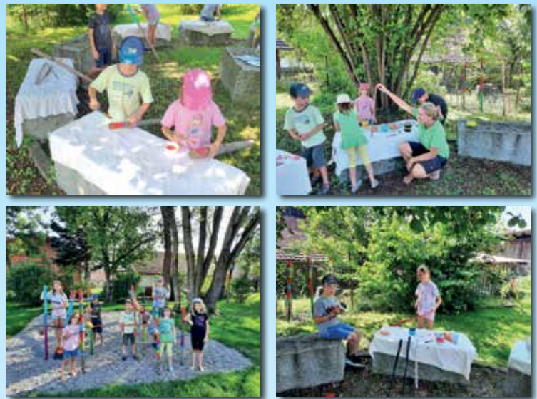
Kreativ im Garten