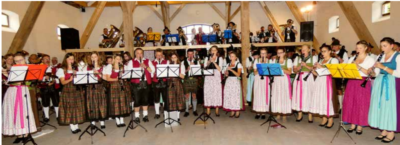
Ein erlebnisreiches Wochenende liegt hinter den Woringer Musikanten. An gleich zwei aufeinanderfolgenden Tagen Anfang September nahmen wir bei großen Veranstaltungen in Oberbayern teil.