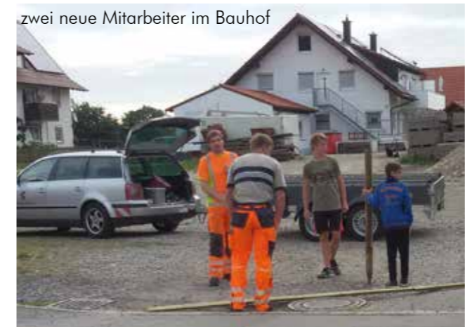
zwei neue Mitarbeiter im Bauhof