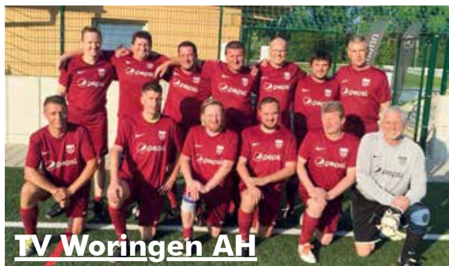
TV Woringen AH

Hallo AH'ler (=Attraktive Herren) und Hobbykicker, wir starten wieder in die Freiluft-Saison und trainieren ab 01.04. immer montags um 19 00 Uhr auf dem Trainingsplatz. Wir sehen uns! Mit sportlichem Gruß!