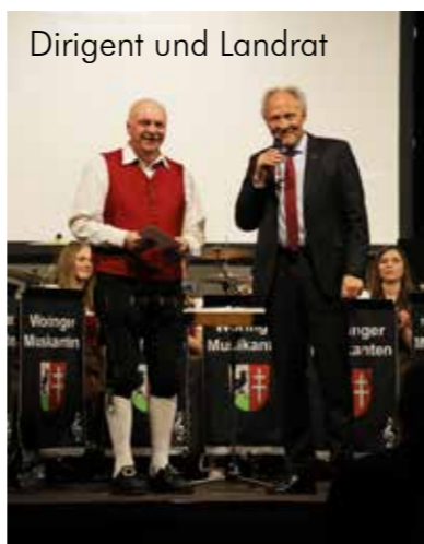
Dirigent und Landrat