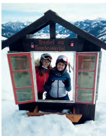
Skitraining in Zöblen, und 4 Mädels, die dabei großen Spaß hatten.